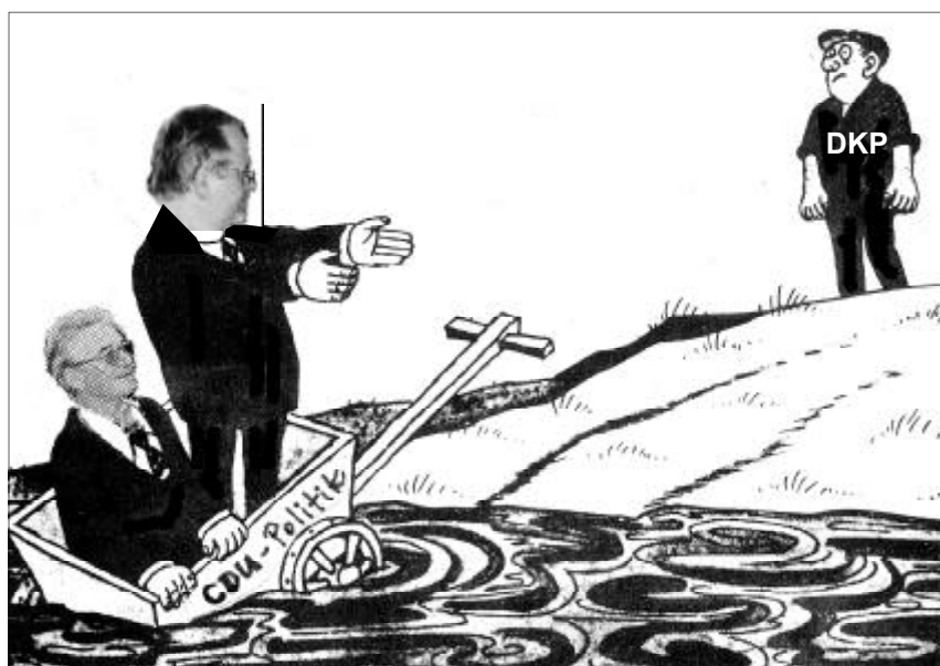
„Nicht immer nur ablehnen, zieht uns wenigstens aus dem Schlamassel!“

Wer Interesse hat, ein solches Fest live zu erleben, sollte sich bitte bei der DKP Püttlingen melden.