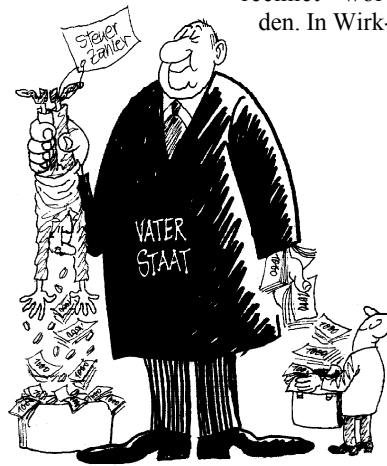
Staatsmoral: „Das Volk ausplündern, damit die Reichen noch mehr bekommen“.

Auch mit den Folgen von Hartz IV setzte sich der Kämmerer in seinen Vorbemerkungen auseinander: Die damaligen Warnungen seien „als Schwarzmalerei abgetan“ und die Reform „schön gerechnet“ worden. In Wirk-