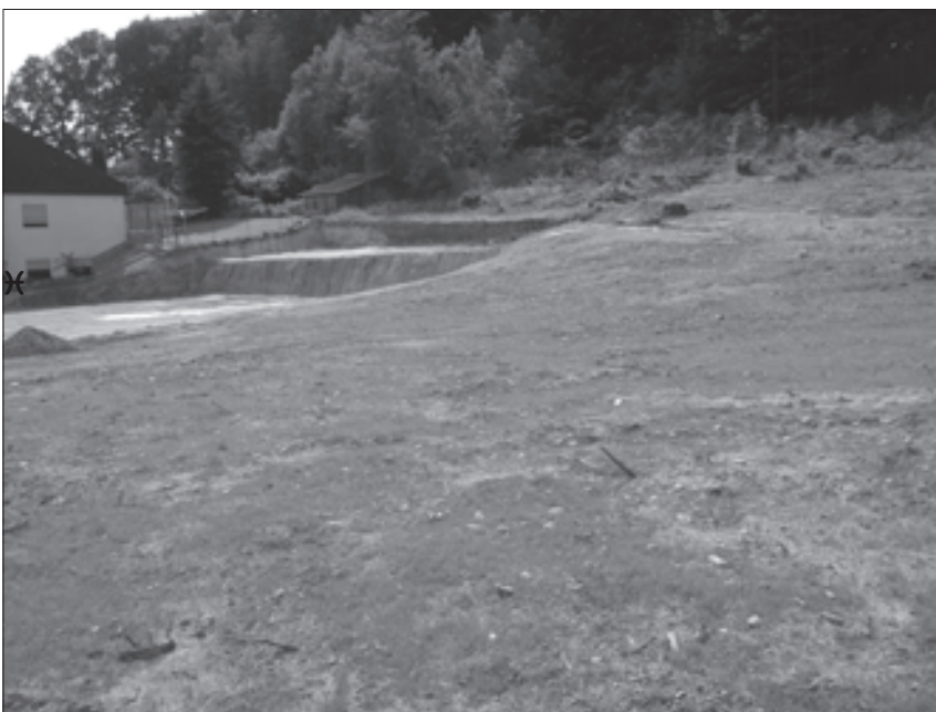
Links im Hintergrund ist die Baustelle K.Adenauer-Straße zu erkennen. Die gerodete Freifläche davor ist zum öffentlichen Streitpunkt geworden.

Die DKP ist stets bemüht, unklare Dinge und Beschwerden der Bürger offen zu diskutieren. Deshalb unser Antrag. Die Debatte hat gezeigt, wie notwendig es war, darüber zu sprechen.