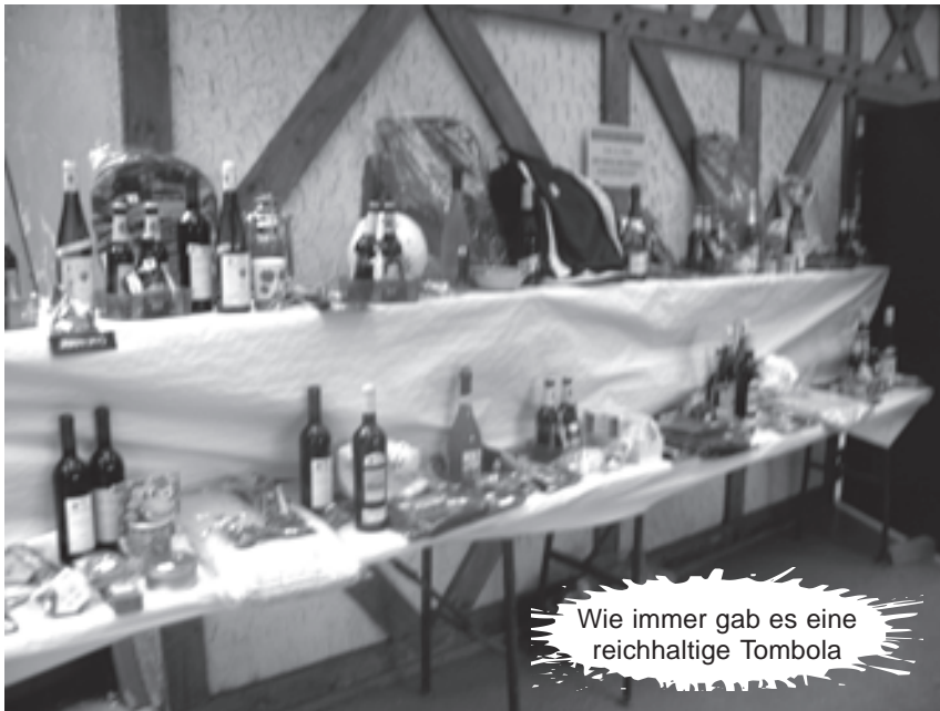
Wie immer gab es eine reichhaltige Tombola

Zum neunten Mal führten die Püttlinger Kommunisten an der Fischerhütte im Kesselfeld ihr Früh-Linksfest durch. Und auch diesmal waren die unterschiedlichsten Linken vertreten. So konnten Mitglieder der Linken im Püttlinger Stadtrat ebenso begrüßt werden, wie Vertreter der SPD-Ratsfraktion und Vorstandsmitglieder der DKP auf Landes- und Kreisebene. An Gesprächsstoff mangelte es den Besuchern nicht. Natürlich war bei preiswertem Essen, Trinken und gutem Programm die Stimmung prächtig.