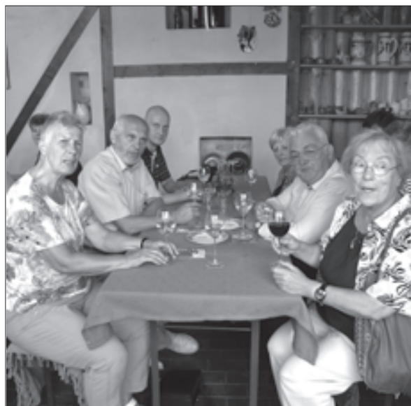
Foto oben: Auch das gehörte dazu, ein gutes Tröpfchen in der Weinstube, gleich neben dem Rathaus.