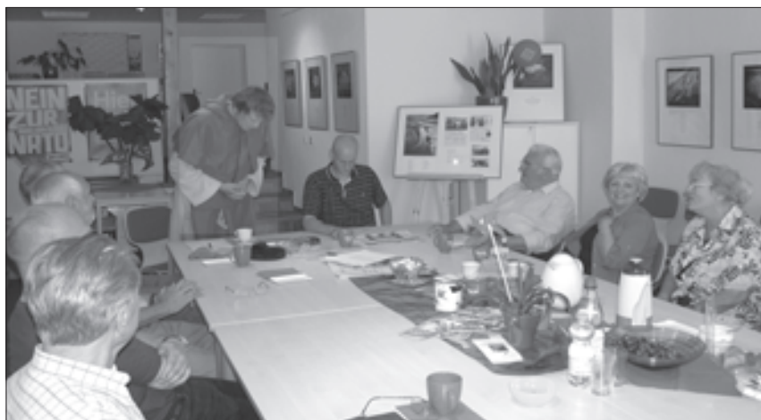
Ein interessanter Erfahrungsaustausch fand statt. Mehr dazu auf Seite 6.