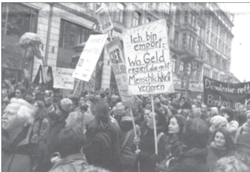
Proteste gegen die Macht des Finanzkapitals gewinnen an Bedeutung.

Die Entscheidung, ob der Fiskalpaket Wirklichkeit wird, hängt letztlich entscheidend davon ab, ob sich auch bei uns in Betrieben und Kommunen wenigstens im Ansatz ein ähnlicher Widerstand gegen diese unsoziale Politik entwickelt, wie in Griechenland, Portugal, Spanien oder Italien.