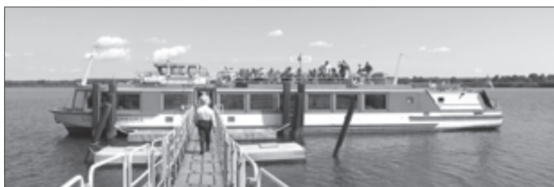
Foto unten und links: Das Fahrgastschiff „Santa Barbara“ besteigen und dann an Bord bei sonnigen Wetter die wunderschöne Fahrt über den Senftenberger See genießen.